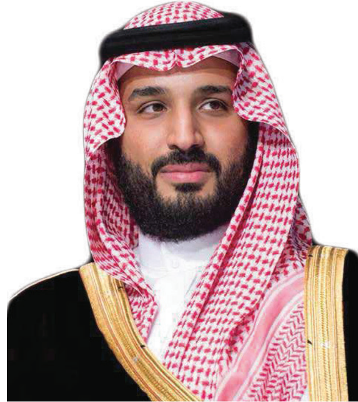
صاحب السمو الملكي الأمير محمد بن سلمان بن عبدالعزيز آل سعود

نهدف للوصول إلى قطاع غير ربحي مهم مبادر وداعم ومؤثر في التعليم والصحة والثقافة والمجالات البحثية