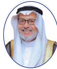
معالي الدكتور عدنان بن عبدالله المزروع الرئيس الفخري