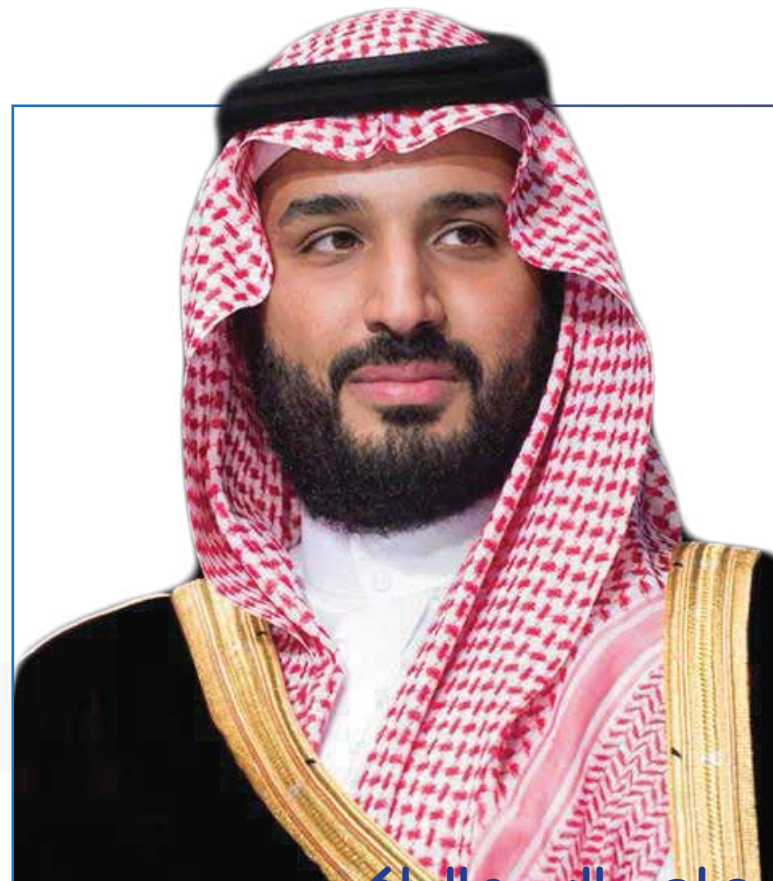
صاحب السمو الملكي

نهدف للوصول إلى قطاع غير ربحي مهم مبادر وداعم ومؤثر في التعليم والصدقة والثقافة والمجالات البحثية